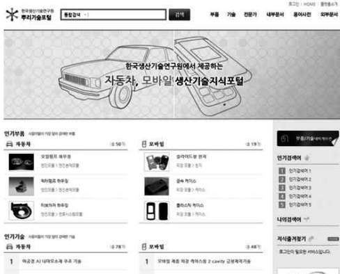
Fig. 4 생산기반 지식공유형 웹포털시스템

용접, 레이저용접이다. 모든 공정에 대해 동종 및 이종 소재, 이종두께용접부에 대해 최적용접조건을 제공하는 것을 목표로 하였다. 공통적인 내용을 제외하고 각 공정별 DB에서 특이한 사항은 다음과 같다. 저항점용접의 경우에는 기존의 AC용접과 함께 DC용접특성을 함께 평가하였으며 3겹 용접에 대한 평가 결과를 DB화하였다. 아크용접의 경우 DC CW용접과 펄스용접에 대해 용접성을 평가하였으며, 현장에서 많이 사용되는 CO2 보호가스 및 혼합가스 분위기에서 용접성평가를 수행하였다. 레이저 용접에서는 레이저 발전기에 따른 용접결과 및 하이브리드 용접결과도 함께 DB화하였다. Fig. 6~8은 CR780DP 소재에 대한 저항점용접, 아크용접, 레이저용접에 대한 데이터베이스의 예이며, 세부 DB는 뿌리기술 포털사이트에서 ( http://www.root-tech.kr )에서 확인할 수 있다. 아직 용접성 평가결과를 포털에 탑재하는 수준이나 향후 정보를 더 구조화하기 위한 논의가 진행되고 있다.