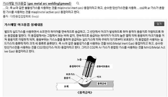
Fig. 5 용접접합관련 용어검색의 예