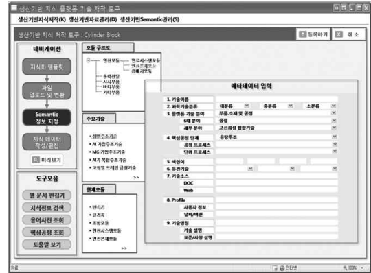
Fig. 2 지식저작 도구

는 화면으로 지식제공자는 자신이 제공하는 생산기반지식들이 어떤 부품, 제품, 공정에 적용될 수 있는지 입력할 수 있다.