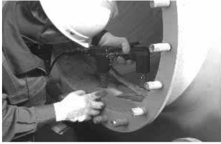
Fig. 3 밀폐 격벽 용접 이음부 자분탐상검사