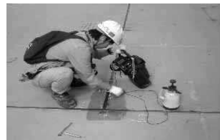
Fig. 2 SAW 기법 용접 이음부 초음파탐상검사