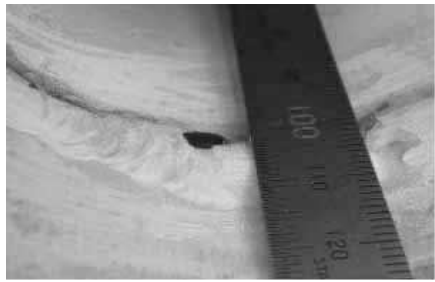
Fig. 4 배관 용접 이음부 용합불량 결함 침투지시모양