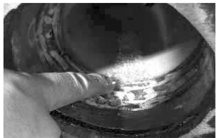
Fig. 5 배관 용접 이음부 누설

용접 이음부의 표면에 입구가 열려 있는 결함을 눈으로 보기 쉽도록 하기 위하여, 형광 물질 또는 가시 염료가 포함된 침투액을 침투시킨 후 현상 처리하여 확대된 결함의 지시 모양으로 관찰하는 방법 - Fig. 4에서 볼 수 있듯이 표면으로 개구된 결함의 검출에 우수하다.