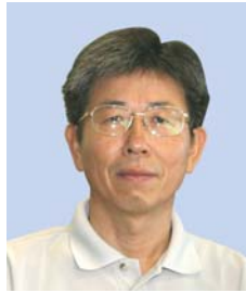
회 장 나 석 주 한국과학기술원 교 수